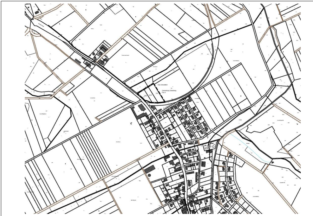
Änderung Flächennutzungsplan o. Maßstab